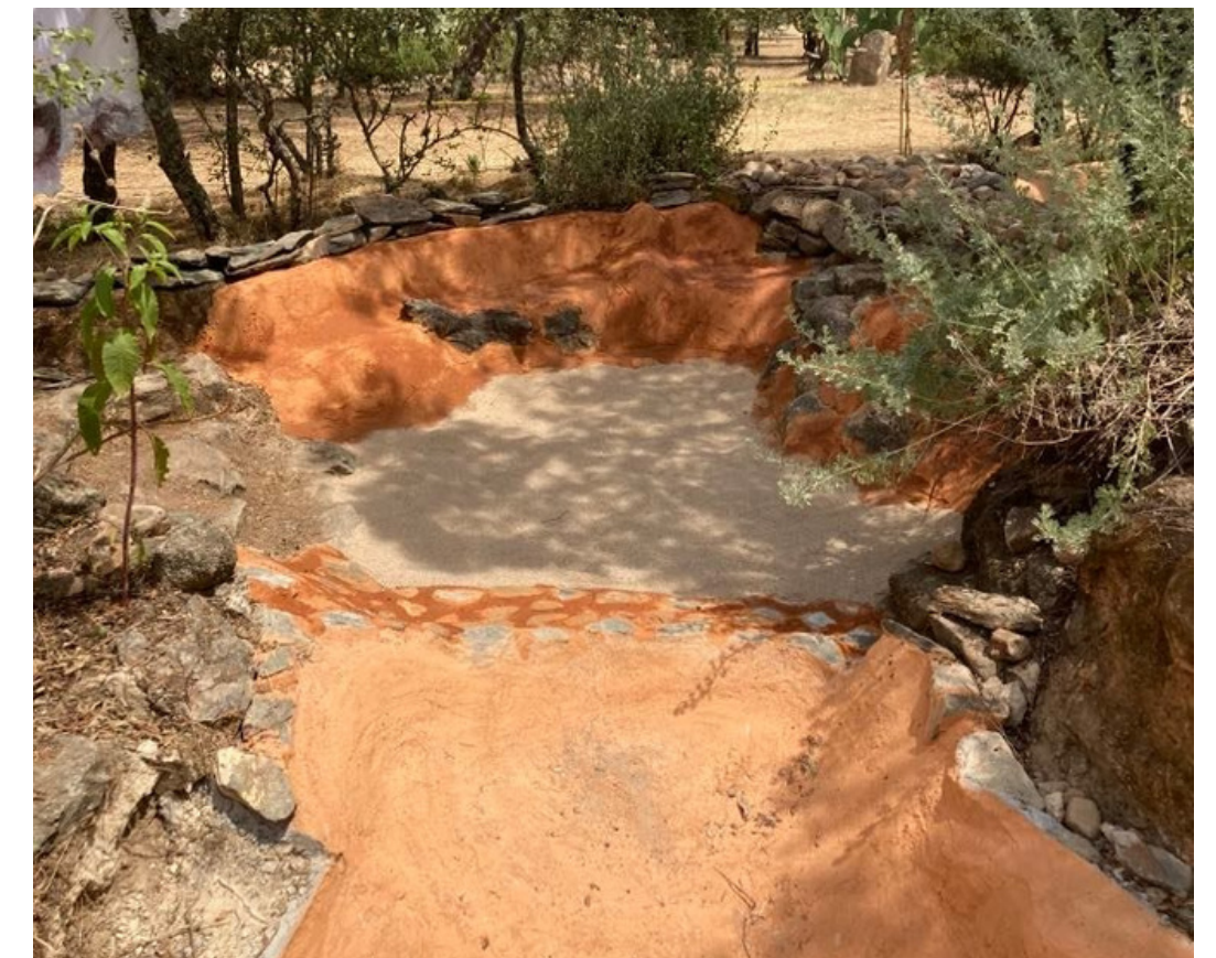
Jardins du Boom festival, 2018 et 2022