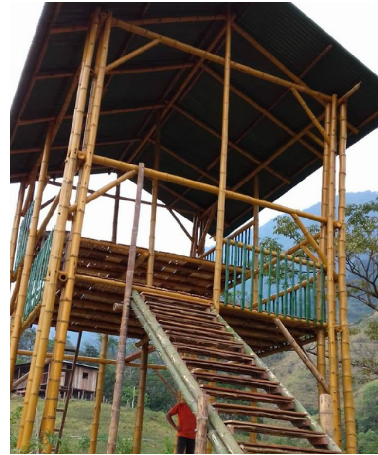
Mirador en Bambous pour l'écoresort "Paso a Paso" - Maracaïbo - Colombie