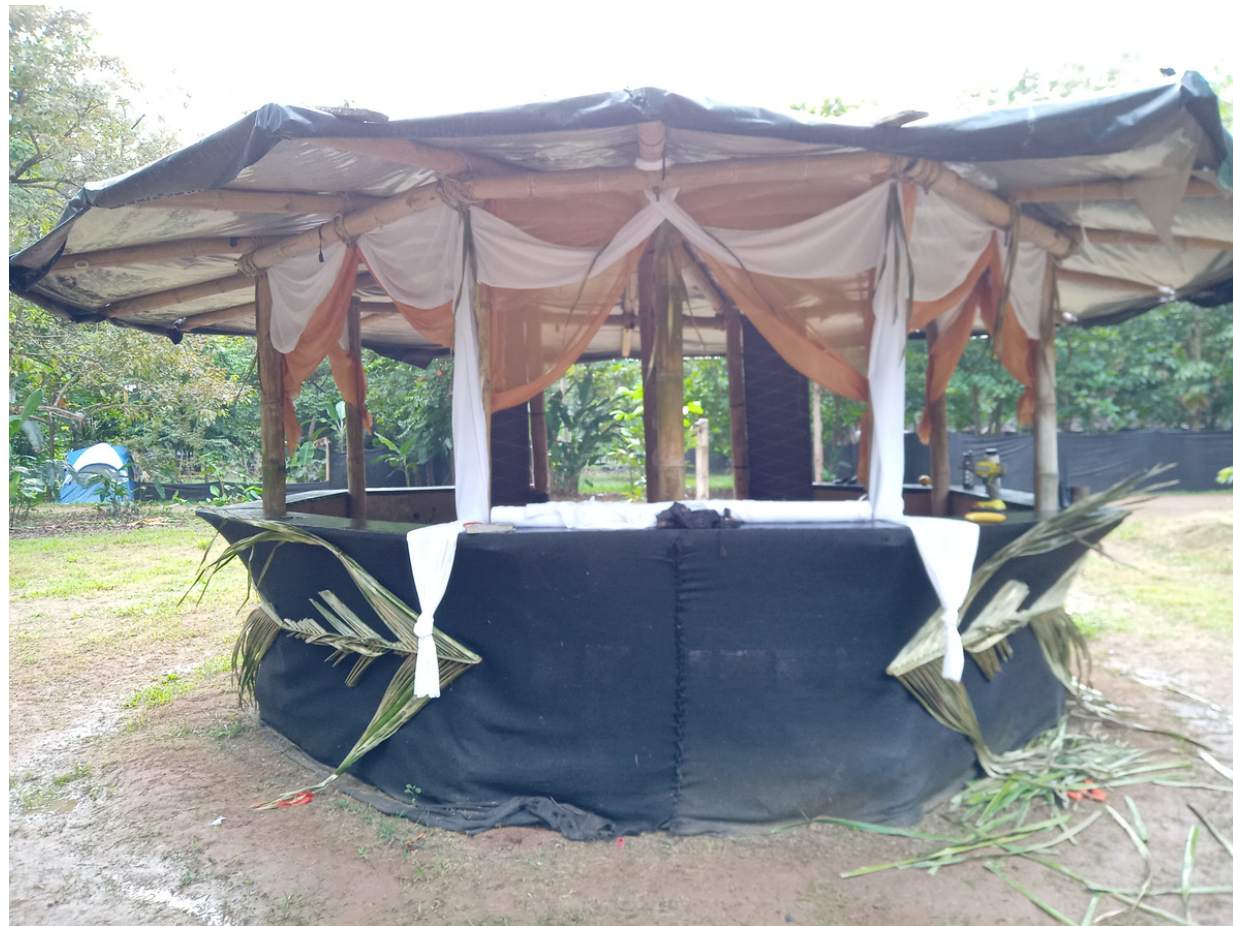
Construction et décoration d'un kiosque d'information - Envision 2018