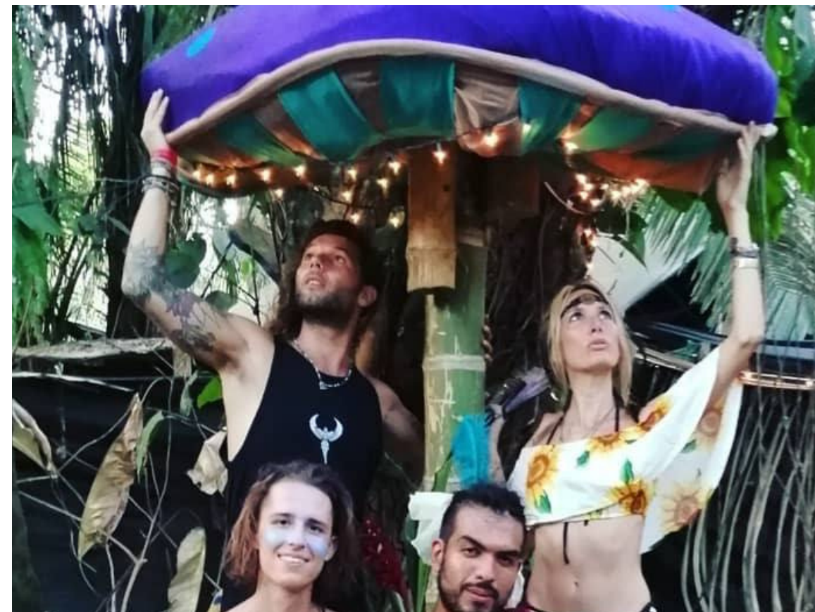
Fairy Forest, création de champignons et de bancs champignons - Envision 2019